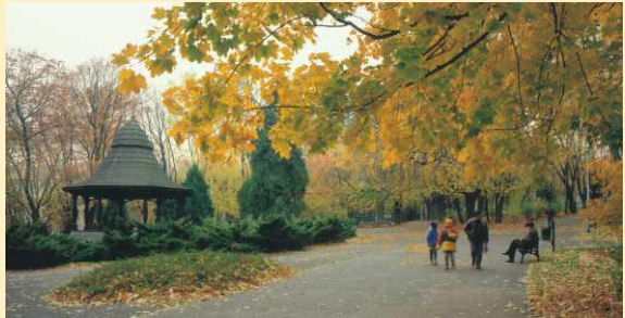
Le Parc de Staszic

L'Église de St André et de Ste Barbara (A/B-7) - construite à la lère moitié du XVII siècle pour les besoins du noviciat du Monastère de Jasna Góra. Sur la localisation une petite source a probablement décidé, dans laquelle selon la légende on a lavé le tableau profané de la Vierge de Czestochowa, volé à Jasna Góra en année 1430. Vers la fin du XIX s. l'église est devenue paroisse. Le bâtiment de l'église en lui-même est entretenu dans le style baroque avec les traces du gothique, à l'origine à une nef, ensuite enrichi à l'agrandissement aux nefs sur les côtés sous forme de chapelles. Le couronnement de la tour est un casque baroque. Derrière l'église se trouve la chapelle de Ste Barbara avec une petite source.