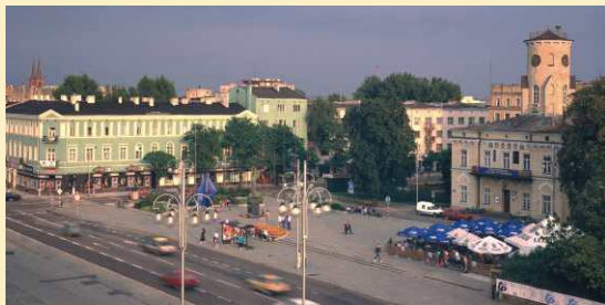
La Place de Biegański

Częstochowa - est une ville connue par beaucoup de gens dans le monde entier, grâce à la présence dans le monastère des Pères Paulins à Jasna Góra de l'Image Miraculeuse de la Vierge de Częstochowa, l'icône de la Madone Noire. C'est vers elle que des milliers de gens effectuent un pèlerinage avec des remerciements et des vœux, dans les moments de joie et des moments difficiles. Les pèlerins ont fait de Częstochowa un des centres majeurs de pèlerinage dans le monde. Le Sanctuaire est visité en moyenne par 4 - 5 millions de pèlerins par an qui viennent de 80 pays du monde. Le pèlerinage à pieds est un phénomène spécifique qui est important à l'échelle mondiale; plus de 200 000 de pèlerins viennent à pieds. Les traces les plus longues comptent plus de 600 kilomètres et le temps passé pour traverser cette distance dure jusqu'à 20 jours.