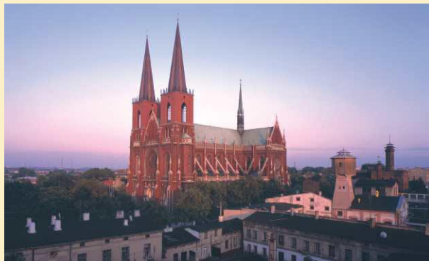
La Cathédrale de l'Archidiocèse sous l'appel de la Ste Famille

Złota Góra - le coteau sur la Piste des Nids d'Aigle, situé en opposé de Jasna Góra. Construite de calcaire, dans ses blancs versants et les excavations, réfléchit des éclat d'or les rayons du coucher de soleil en dessus de la ville. De cet endroit s'étend une vue inoubliable le panorama de toute la ville de Częstochowa. De son temps le calcaire a été un matériau de construction très populaire, et de la pierre extraite ici on a construit beaucoup de bâtiments à Częstochowa. Actuellement les excavations fermés sont en elles-même une certaine attraction touristique.