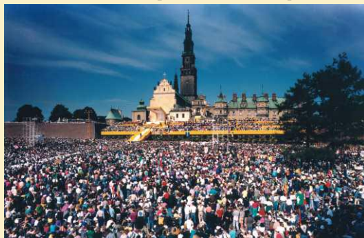
Célébrations devant le sommet de Jasna Góra

Le roi Jan Kazimierz dans les Serments de Lvov a déclaré Marie Mère de Dieu la Reine de Pologne. La forteresse a supporté les sièges suédois pendant la guerre du nord en années 1702, 1704 et 1705. En 1717 on a effectué le premier couronnement sur les terres de la Pologne du tableau de la Madone Noire. Le monastère a confirmé sa puissance militaire quand les