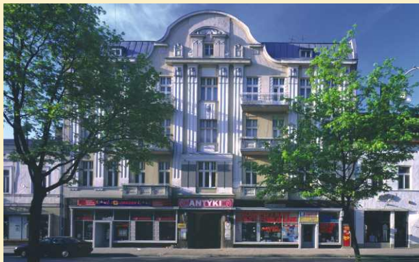
Un des immeubles dans l'Allée NMP

L'Eglise du Très Saint Nom de Marie (C/D-4) - édifée ensemble avec le monastère des Sœurs Mariawita dans les années 1859-1862. Les intérieurs néogothiques, à une nef, sans presbytère à part, couvre un plafond de caissons avec les macarons, et les murs sont couverts de peintures datant de la sécession aux motifs fleuris. L'Eglise, à caractère monastique au début, actuellement a été redesigné en église universitaire. A l'intérieur se trouvent les tableaux des peintres connus il y a entre autres le tableau de l'Immaculée Conception de la Vierge Marie sorti du pinceau de Rafał Hodziewicz ainsi que les travaux de Januar Suchodolski et de Pierre Le Brin. Sur un chœur en bois se trouvent les orgues de l'année 1935 environ, en dessous du chœur par contre se trouvent les bénitiers bouclés aux caractéristiques baroques, en grès.