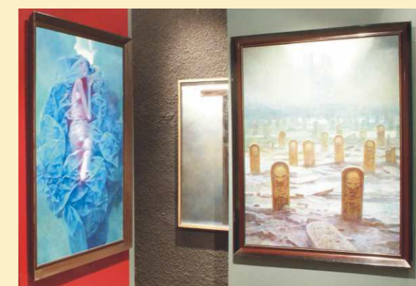
La collection des œuvres de Zdzisław Beksiński

La Bibliothèque - est divisée en deux parties une vieille et une neuve. Dans la vieille bibliothèque on a réuni près de 8 mille d'imprimés anciens et les manuscrits du Moyen Age illuminés, dont un exemplaire unique de collections royales des Jagielloni. La voûte de la bibliothèque est ornée des fresques de la 1ère moitié du XVIII siècle, par contre les livres sont gardés dans les étuis en bois reliés de cuir avec des impressions dorées. Des magnifiques armoires de bibliothèque les tables de marquetrie, l'œuvre d'un paulin, le père Gregoire Woźniakowicz. Les Informations de Jasna Góra, tel. +48 34/ 377 74 08 www.jasnagora.pl