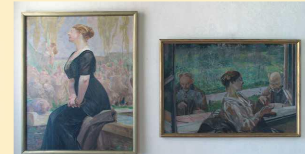
L'Exposition des œuvres de Jacek Malczewski

Le Musée de l'Archidiocèse de Częstochowa (A/B-6) Les collections du Musée ce sont les monuments de l'art sacré de Częstochowa et des environs, créés aux époques différentes, qui ont une valeur non seulement artistique mais aussi historique et culturelle. Parmi les sculptures on doit différencier la Vierge avec l'Enfant de l'année 1430 environ, le personnage de Jesus Christ ou bien les personnages des saints tels que: St Martin de Mstów de l'année 1500 environ, ou bien St Joachim du XVIII siècle. Les compositions de peinture ce sont en majorité les tableaux qui présentent les saints proches de la spiritualité polonaise religieuse, entre autres Ste Anne, St Antoine Padewski, St Roch et St Sébastien, St Paul l'Ermite ainsi que les scènes de la vie de Jesus Christ et l'effigie de la Vierge. Une partie intéressante des collections les monnaies rares ainsi que les médailles tirées lors de différentes occasions religieuses qui fait partie d'une culture propre à l'Eglise. ul. św. Barbary 41, tel. +48 34/ 368 33 61 ouverture: du mardi au samedi 9.00 - 13.00