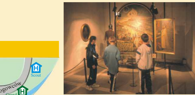
L'Arsenal de Jasna Góra

Le Musée de l'Archidiocèse de Częstochowa (A/B-6) Les collections du Musée ce sont les monuments de l'art sacré de Częstochowa et des environs, créés aux époques différentes, qui ont une valeur non seulement artistique mais aussi historique et culturelle. Parmi les sculptures on doit différencier la Vierge avec l'Enfant de l'année 1430 environ, le personnage de Jesus Christ ou bien les personnages des saints tels que: St Martin de Mstów de l'année 1500 environ, ou bien St Joachim du XVIII siècle. Les compositions de peinture ce sont en majorité les tableaux qui présentent les saints proches de la spiritualité polonaise religieuse, entre autres Ste Anne, St Antoine Padewski, St Roch et St Sébastien, St Paul l'Ermite ainsi que les scènes de la vie de Jesus Christ et l'effigie de la Vierge. Une partie intéressante des collections les monnaies rares ainsi que les médailles tirées lors de différentes occasions religieuses qui fait partie d'une culture propre à l'Eglise. ul. św. Barbary 41, tel. +48 34/ 368 33 61 ouverture: du mardi au samedi 9.00 - 13.00