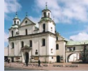
St. Sigismund Kirche