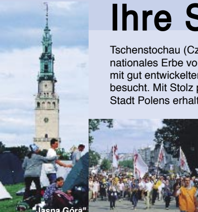
Jasna Góra Der Helle Berg

Tschenstochau ist eine empfehlenswerte Stadt