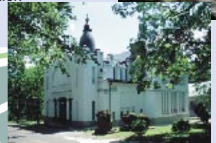
Ausstellungshalle des Tschenstochauer Museums