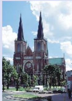
Dom der Heiligen Familie