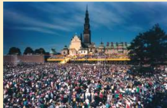
Feierlichkeiten vor dem Paulinerkloster

König Jan Kazimierz legte in Lemberg ein feierliches Gelübde ab und erklärte die Mutter Gottes zur Königin Polens. Während des Nordischen Kriegs hielten die Festungsanlagen 1702, 1704 und 1705 der schwedischen Belagerung stand. 1717 wurde die erste Krönung eines Gnadenbildes auf polnischem Gebiet