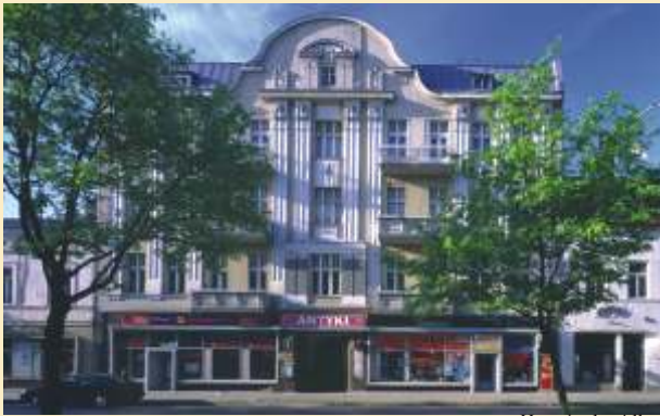
Haus in der Allee

Kirche zum Heiligsten Namen Maria (C/D-4) - erbaut zwischen 1859 und 1862 mit dem Kloster der altkatholischen Mariaviten-Schwestern.