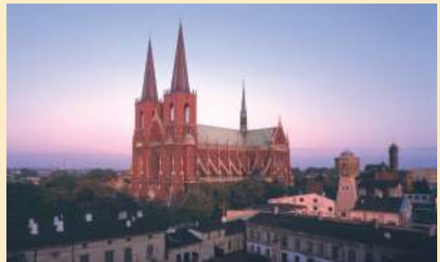
Erzkathedrale zur Heiligen Familie

Złota Góra (Goldener Berg) - Erhebung an der „Adlerhorstroute“ gegenüber Jasna Góra. An seinen weißen Abhängen und Steinbrüchen reflektiert der Kalkstein die über der Stadt untergehende Sonne. Von hier hat der Besucher einen wunderschönen Blick über die gesamte Stadt. Kalkstein war früher ein beliebtes Baumaterial und zahlreiche Tschenstochauer Gebäude wurden aus dem hier gewonnenen Stein gebaut. Heute wird hier kein Stein mehr gebrochen und der Berg ist eine reine Besucherattraktion.