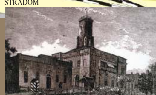
Władysław Dmochowski "Rathaus" 1876 r.