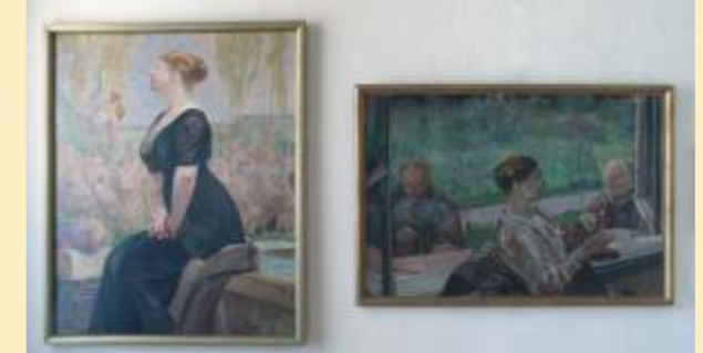
Ausstellung von Werken des Malers Jacek Malczewski

ul. Św. Barbary 41, tel. +48 34 / 368 33 61 Geöffnet: Dienstag - Samstag 9.00 - 13.00 Uhr