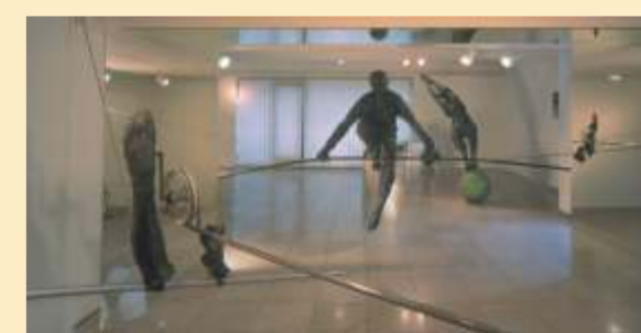
Einzigartige Skulptur von Jerzy Kędziara

Ständige Ausstellung: Historische Eisenbahntechnik Bahnhof Tschenstochau-Stradom, ul. Pułaskiego, tel. +48 34 / 363 59 31, 322 26 89, www.tpkwz.wo.pl Geöffnet: Dienstag, Donnerstag, Samstag 10.00 - 13.00 Uhr oder an anderen Tagen nach vorheriger Vereinbarung