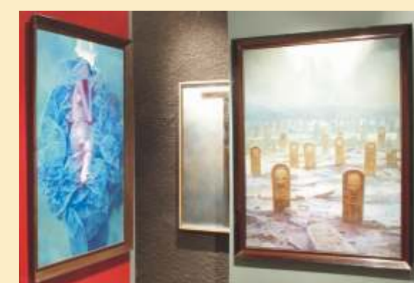
Werke des Malers Zdzisław Beksiński

Jasna Góra. Informacja telefon: +48 34 / 365 38 88 ul. Kordeckiego 2, www.jasnagora.pl, e-mail: jci@jasnagora.pl