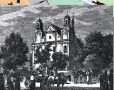
Władysław Dmochowski "St. Sigismund-Kirche" 1876 r.